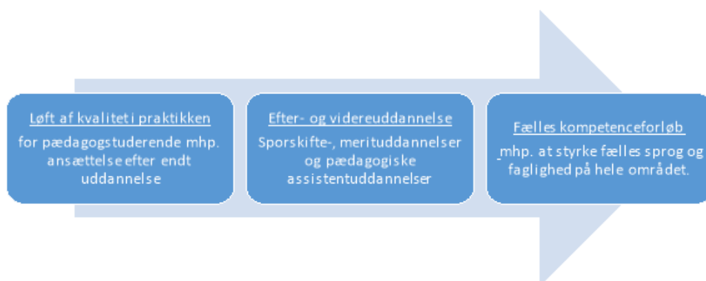
Figur 1: kompetenceindsatsområder mhp. at øge kvaliteten i den pædagogiske praksis på dagtilbudsområdet

Udover det faste fokus på fastholdelse i den daglige drift har Økonomiudvalget den 17. juni besluttet, hvordan de afsatte midler til det videre arbejde med opgaveudvalgets anbefalinger til fastholdelse og rekruttering skulle fordeles. Der var afsat 0,5 mio. kr. som blev løftet med 2 mio. kr. i budgetaftalen 2025-32. For dagtilbudsområdet betyder det, at der ansættes en fastholdelses- og rekrutteringsmedarbejder med bl.a. opgaver som praktikkoordinator mhp. et tættere samarbejde med professions-skolen og udvikling af lokalt netværk for studerende, at der tildeles vejleder-diplommodul til pædagoger med vejlederopgaver, samt at der gives midler til styrket faglighed med midler til fag-oplæg og fagbøger i daginstitutionerne.